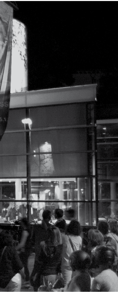
Nacht der Museen

Auch zukünftig werden die Ausstellungen des Museums durch ein Rahmenprogramm ergänzt. Dabei sind klassische Formate wie Lesungen, Vorträge, Gespräche mit Künstlern und Künstlerinnen, Expertinnen und Experten sowie die Nacht der Museen weiterhin ein Bestandteil. Durch eine Kooperation mit einem Theater oder Schauspielern wird das Angebot der Lesungen durch szenische Lesungen ergänzt. Zudem finden Konzerte im kleinen Rahmen, Jazzfrühschoppen und Science Slams statt. Mit Führungen durch das Depot und einem Blick hinter die Kulissen ermöglicht das Museum interessierten Besucherinnen und Besuchern, neue Eindrücke zu gewinnen. Hinzu kommen kleinere Exkursionen in die Region und Veranstaltungen zu Stadtereignissen.