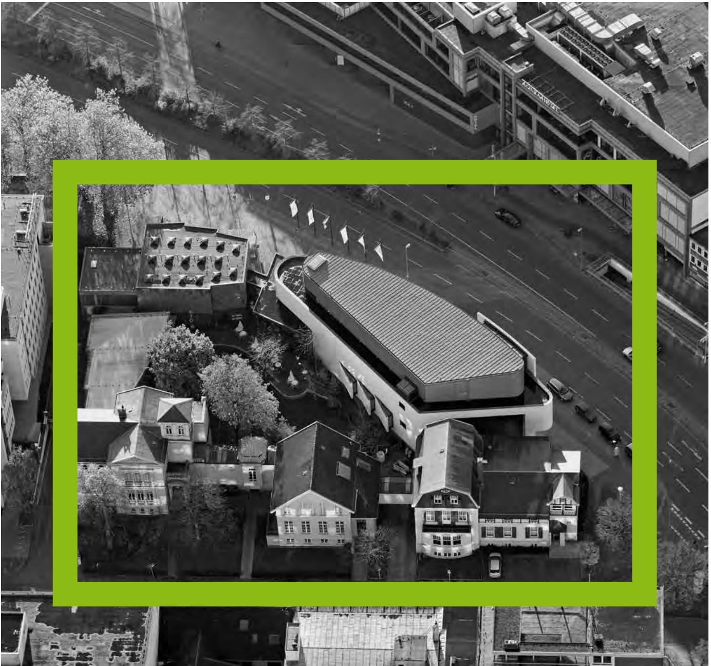
Luftaufnahme von Stadtmuseum, Horst-Janssen-Museum und den Villen, 29.06.2009

Aldo Rossi, Architekt und Architekturtheoretiker