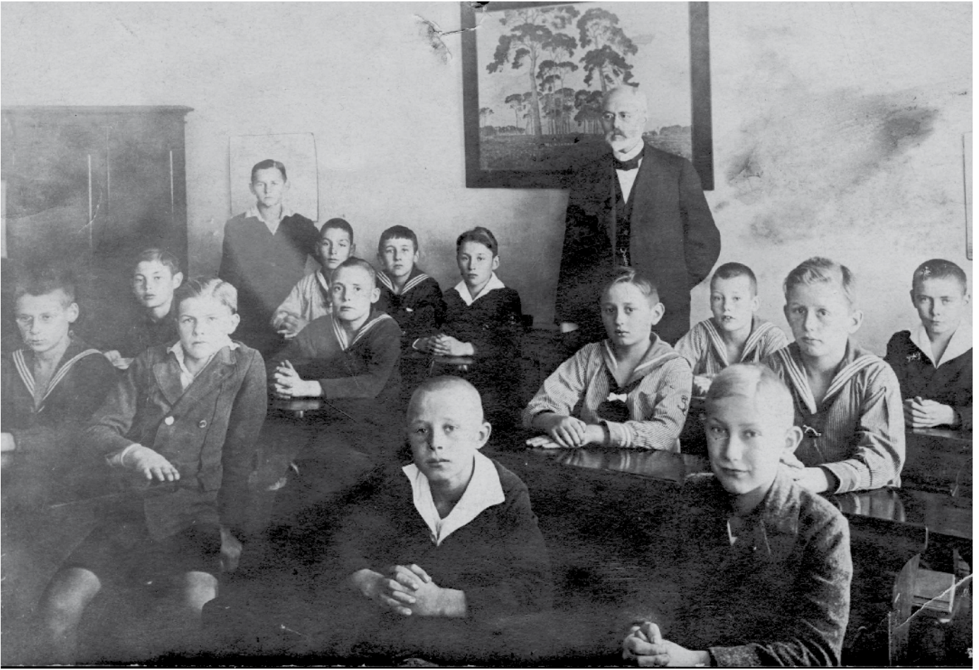
Altes Gymnasium, 1923