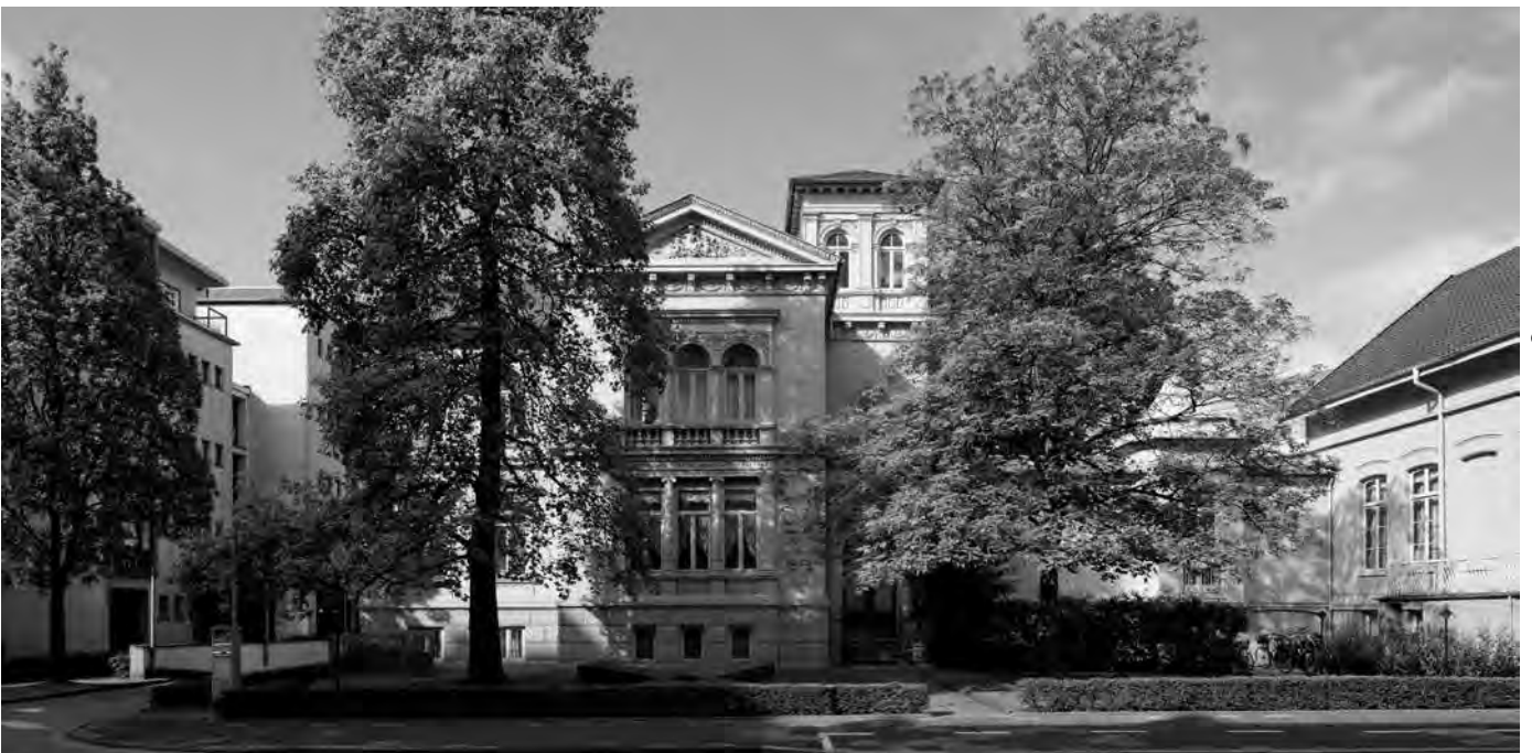
Außensicht Francksen-Villa in der Raiffeisenstraße