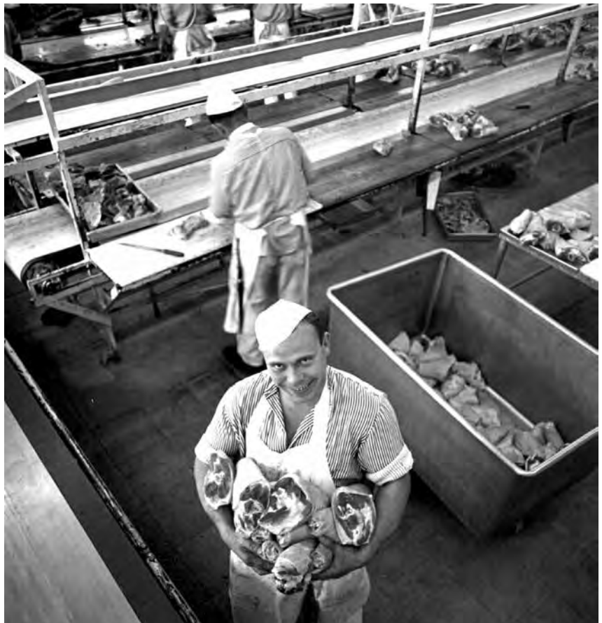
GEG-Fleischwarenfabrik, 1960er Jahre

In der aktuellen Sammlung fehlen manche Perspektiven, insbesondere Aspekte der Alltagsgeschichte. Aus diesem Grund soll das Sammlungsgedächtnis der Stadt fortgeschrieben und ergänzt werden. Der Fokus liegt dabei auf der Ergänzung dreidimensionaler und fotografischer Objekte mit einem Bezug zur historischen Alltagskultur und Jugendkultur der Stadt Oldenburg, die derzeit in der Sammlung unterrepräsentiert sind. Die Sammlungstätigkeit des Museums wird zukünftig auch kulturelle Vielfalt einschließen, so dass etwa Migrationsgeschichte als ein integrierter Teil der Stadtgeschichte erzählt werden kann.