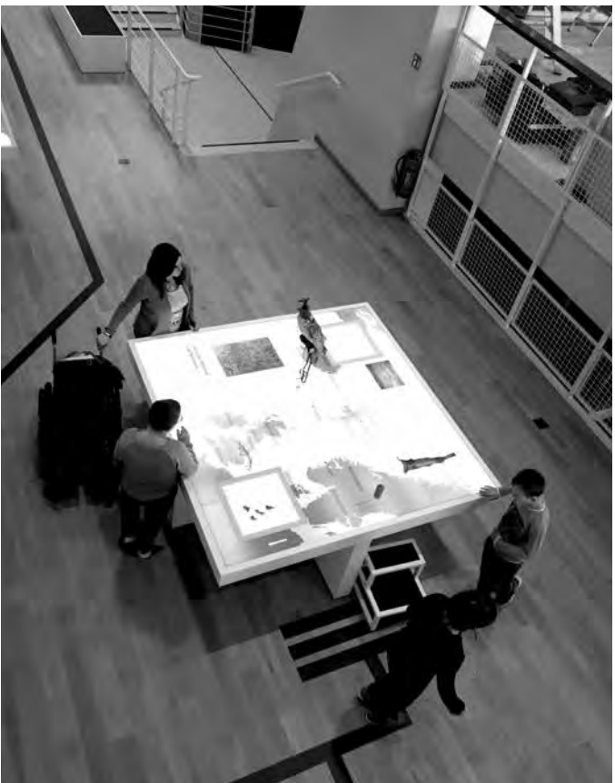
Barrierefreier Zugang und Leitsystem, Deutsches Schifffahrtsmuseum Bremerhaven