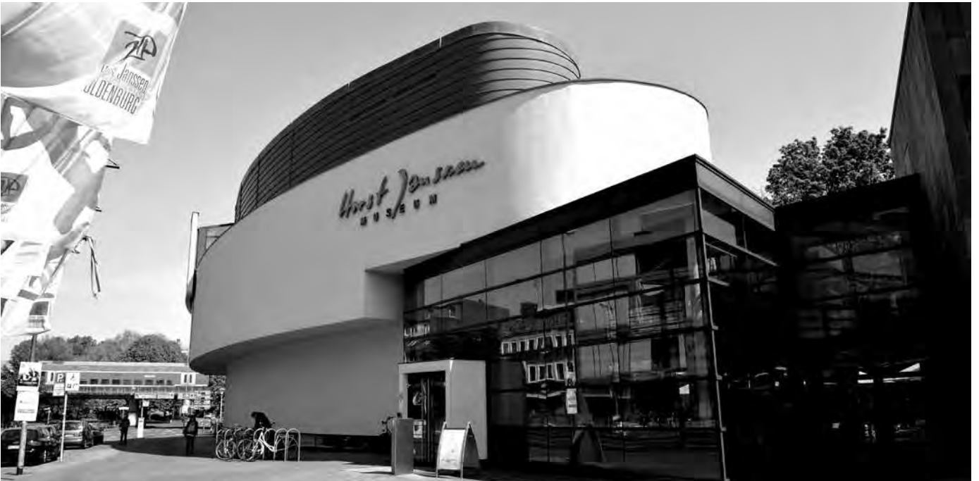
Außensicht Horst-Janssen-Museum