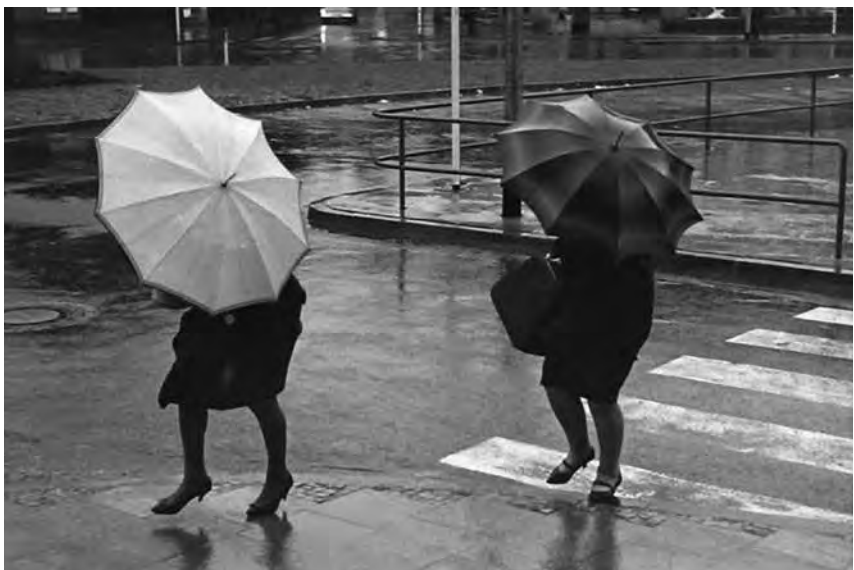
Sträßenzug während der Überschwemmung durch die Sturmflut, 1962