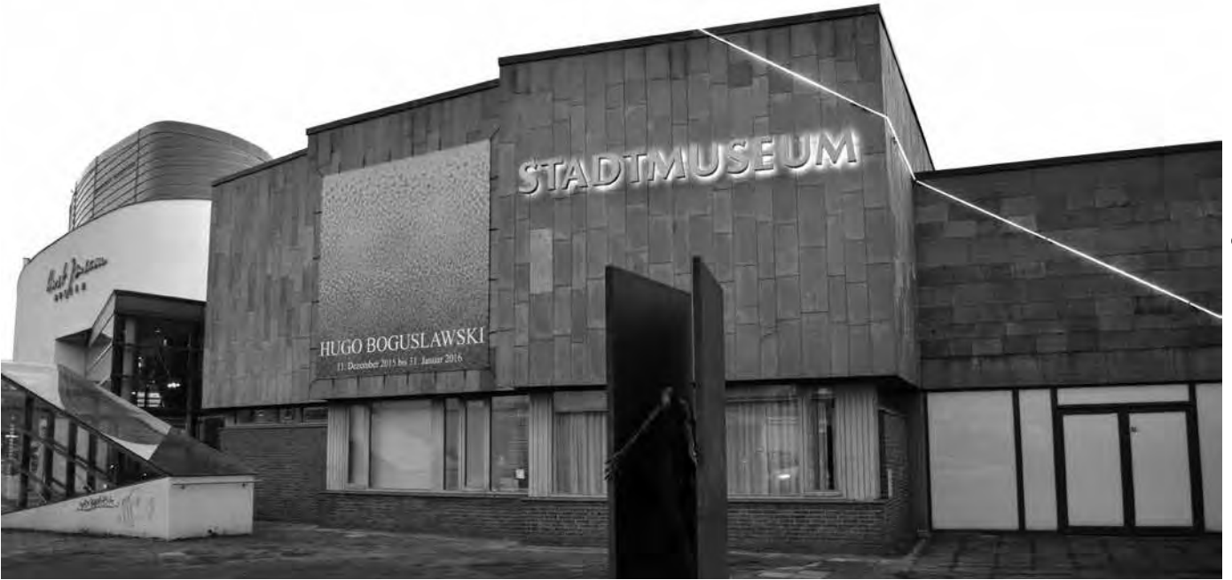
Außensicht Stadtmuseum Oldenburger