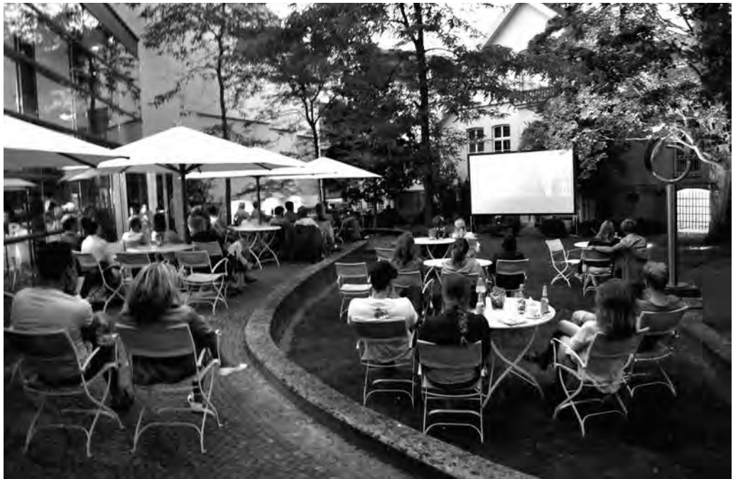
Open-Air-Kino im Museumsgarten