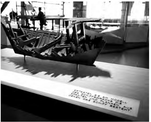
Tastmodell und Braille-Schrift, Deutsches Schifffahrtsmuseum Bremerhaven