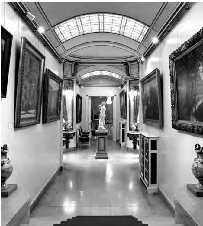
Zwischentrakt, der die Francksen-Villa mit der Jürgen'schen Villa verbindet

Die Räume der Ballin'schen Villa werden hingegen zu Seminarräumen und Büros für die Mitarbeiterinnen und Mitarbeiter des Museums umfunktioniert.