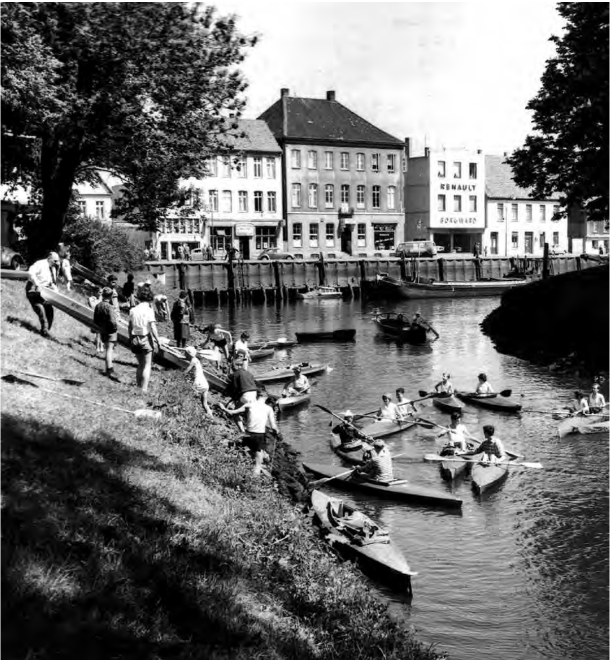
Stautorplatz 1960