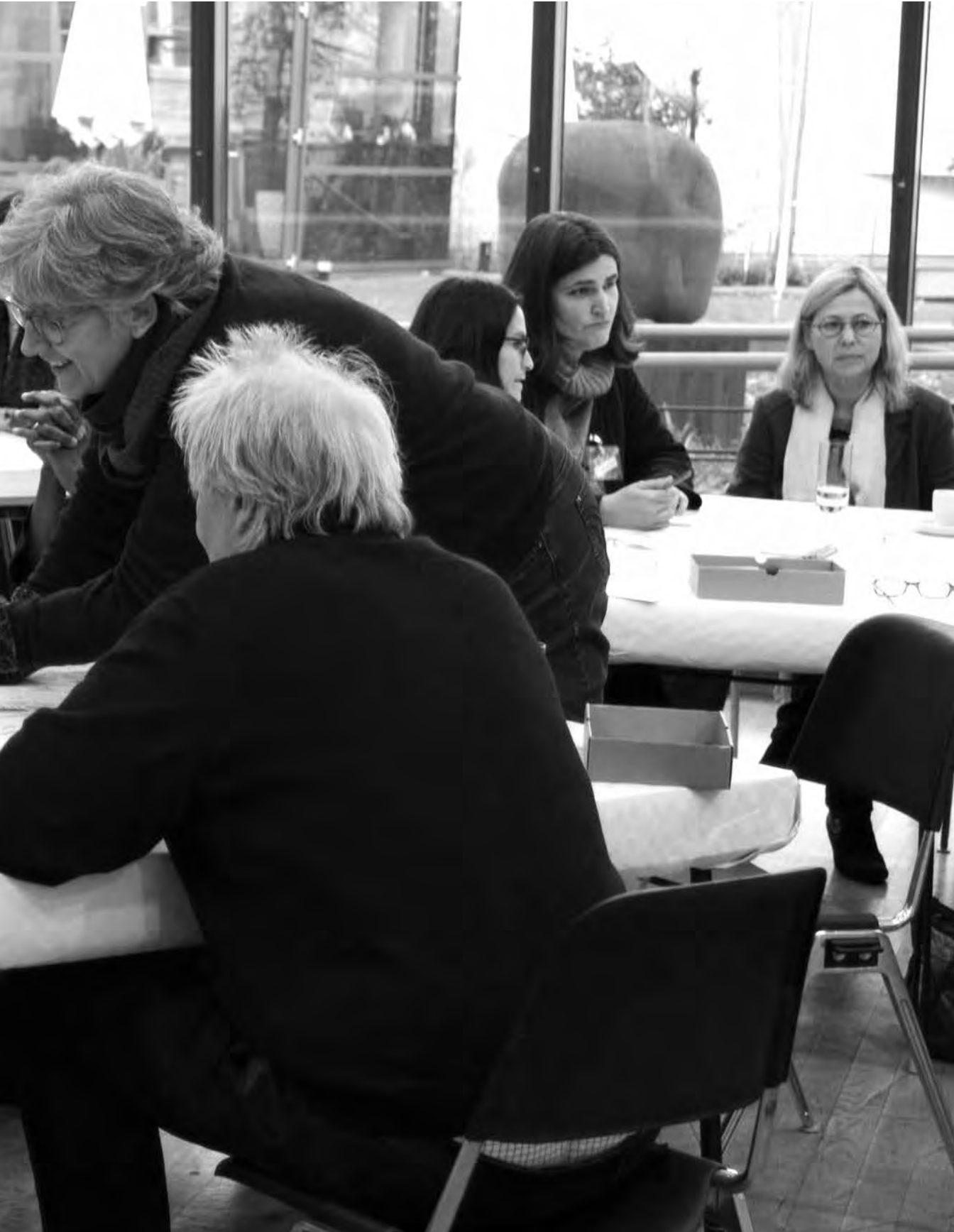
Bürgerbeteiligung zur Entwicklung des Stadtmuseums, Dezember 2016