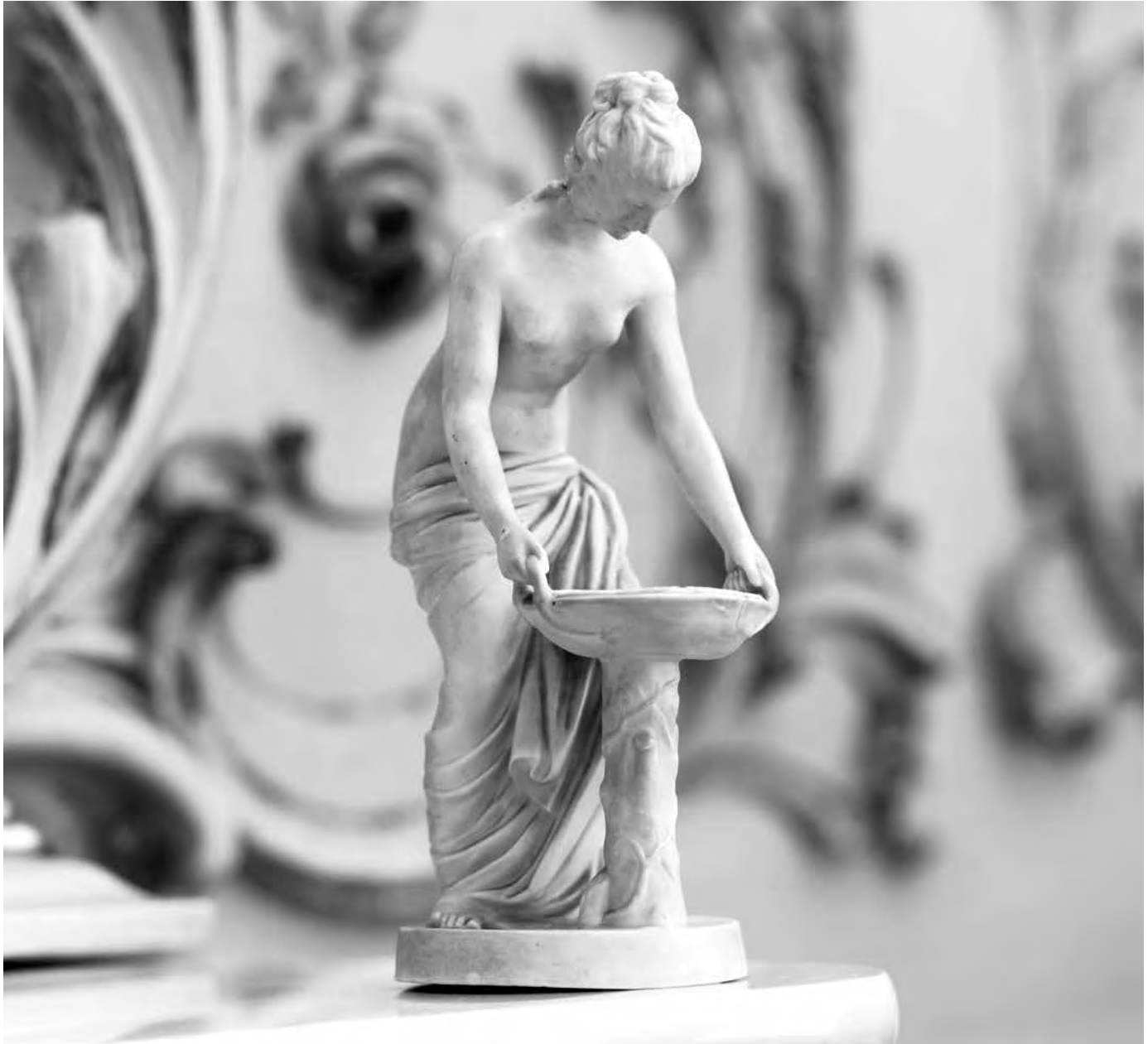
Skulptur im Weißen Salon