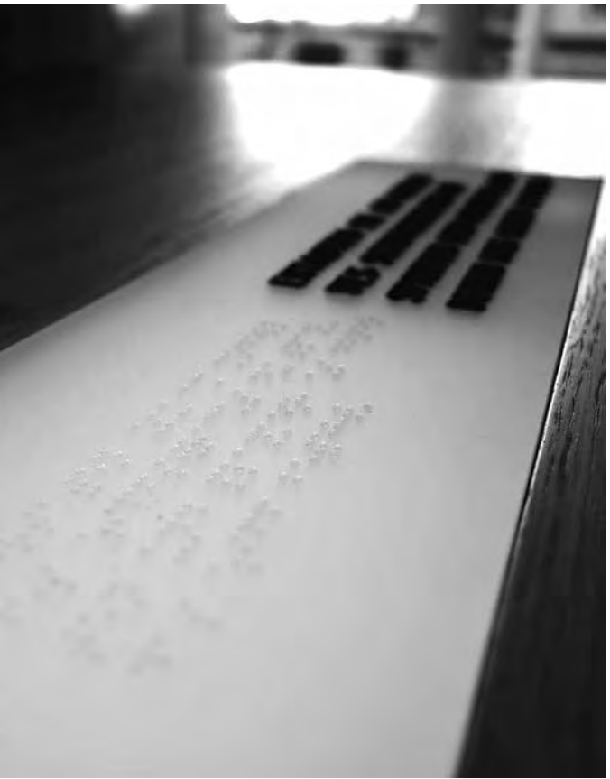
Braille-Schrift, Deutsches Schifffahrtsmuseum Bremerhaven