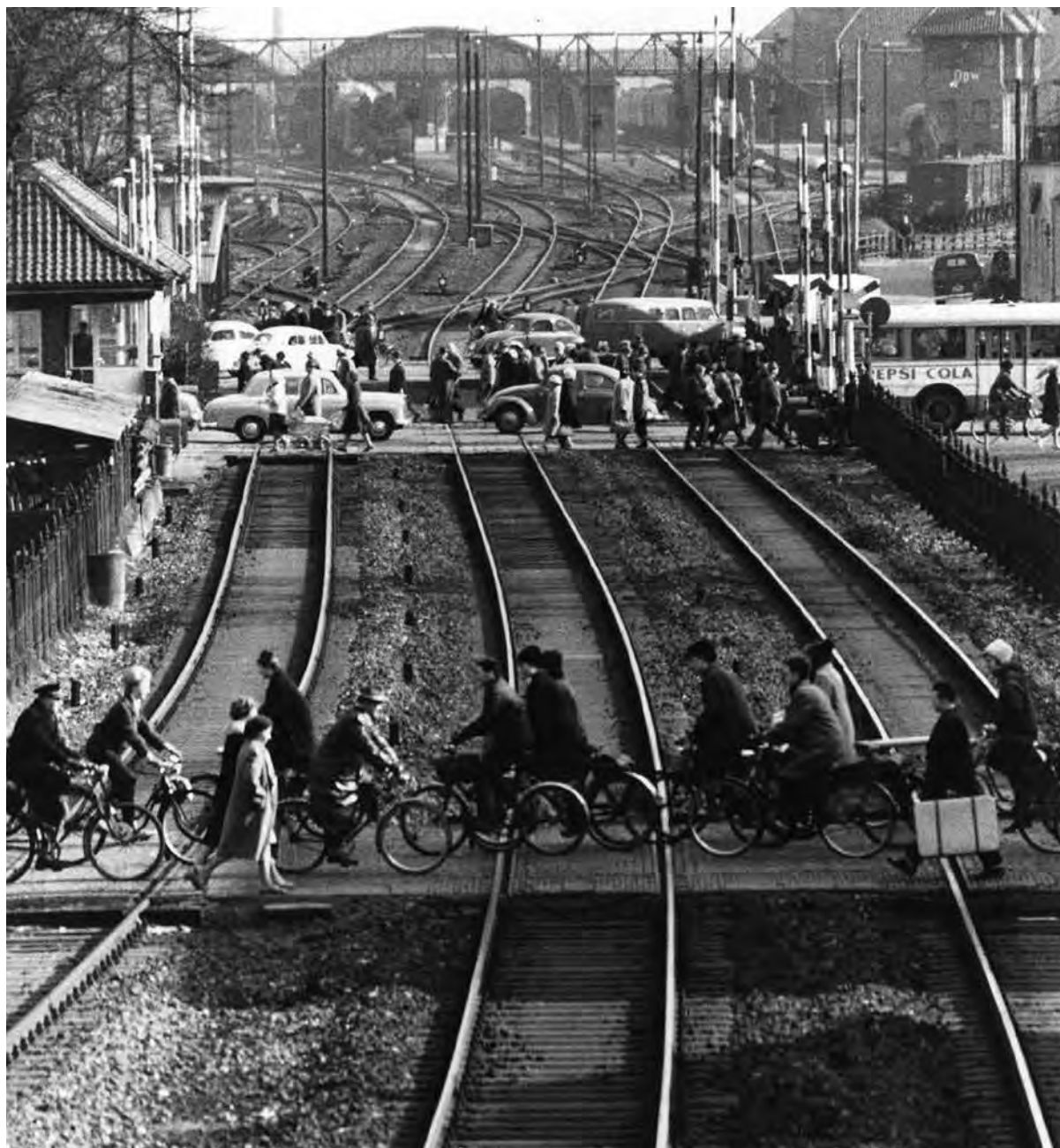
Bahnübergänge am Pferdemarkt vor der Bahnhochlegung, um 1963

Thomas Krüger, Bundeszentrale für politische Bildung